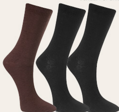
KIT 01 Marrom | Preto | Preto 7897133 926 641