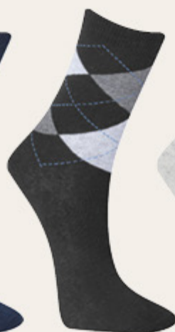
08 Preta 7897133 905 240