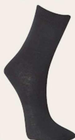
03 Preta 7897133 961 680