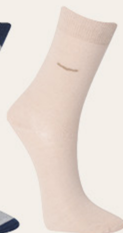
12 Bege 7897133 905 288