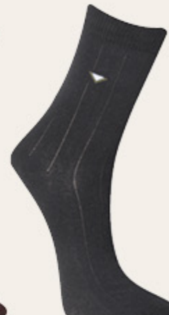
05 Preta 7897133 905 219