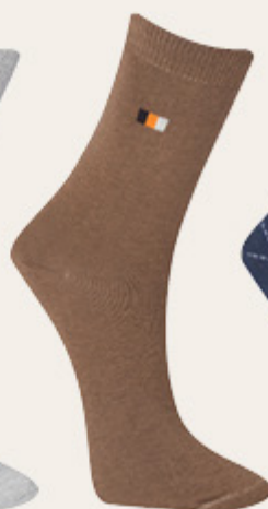
10 Raiz 7897133 905 264