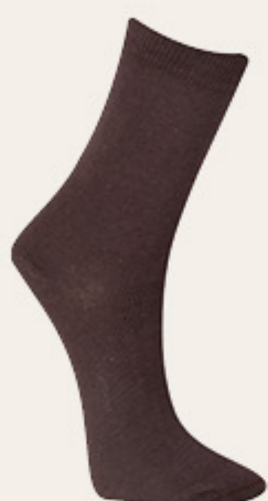
02 Marrom 7897133 961 673