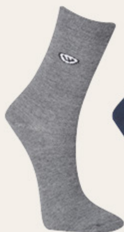
06 Grafite 7897133 905 226