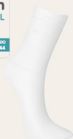
01 Branca 7897133 961 666