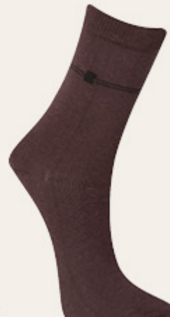
04 Marrom 7897133 905 202