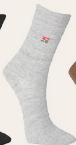
09 Mescla 7897133 905 257