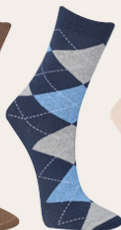
11 Marinho 7897133 905 271