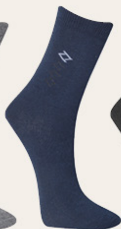
07 Marinho 7897133 905 233