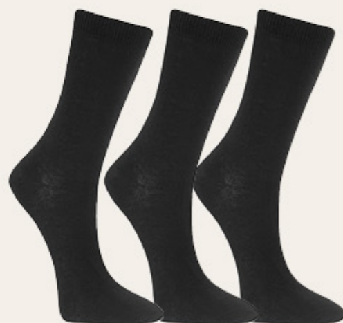
KIT 02 Preto 7897133 926 658